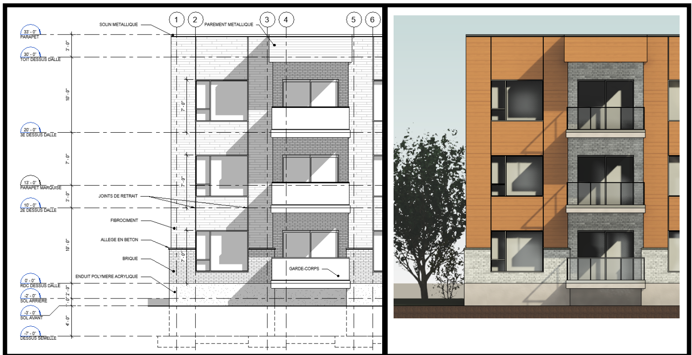
ÉLÉVATION D'EXECUTION / CONSTRUCTION/WORKING ELEVATION

Presentation elevations (image on right) convey the cladding materials used as well as particulars for doors, windows and roofs. The foundation below grade is not shown. The working/construction elevation (image on left) in addition to the information provided on a presentation plan also includes the foundation below grade (indicated with hidden lines) as well as important technical information such as vertical dimensions, roof slopes, window, door and identification of finishing materials.